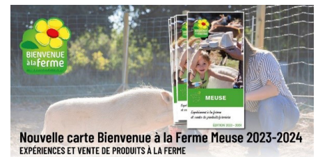
Nouvelle carte Bienvenue à la Ferme Meuse 2023-2024 EXPERIENCES ET VENTE DE PRODUITS À LA FERME

La nouvelle carte 2023/2024 des adhérents Bienvenue à la ferme en Meuse est sortie ! Elle présente l'ensemble des exploitations agricoles agréées Vivez et Mangez fermier . N'hésitez pas à nous contacter pour disposer de ce document et le diffuser largement autour de vous ! Cliquez ici pour découvrir le document.