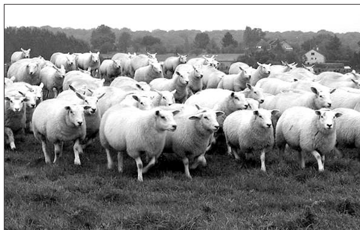
Faire un diagnostic et élaborer différents scénarios possibles.