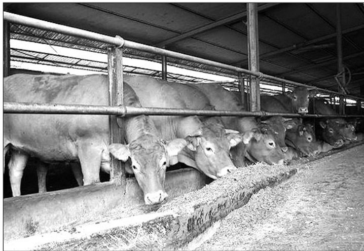
L'étude s'appuie sur l'expérience des Réseaux d'élevage.

arrivant à échéance, de nombreux éleveurs s'interrogent sur les différentes solutions à adopter : ai-je intérêt à investir, à me regrouper, à arrêter la production... ?